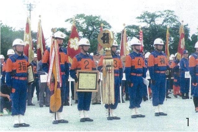
1 出初式 / 2 検閲

第五分団は、地域を七つに分けて七つの部（屯所）があり、総勢一三〇名で活動しています。