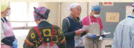
うまみの作るぞー