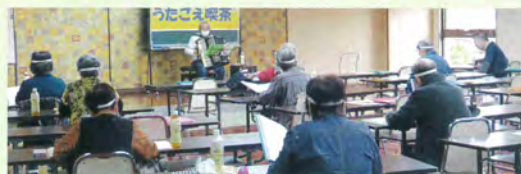
楽しく歌えました