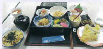
美味しかった夕食