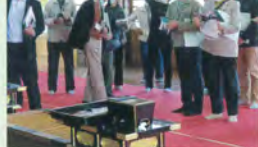
説明を聞く参加者