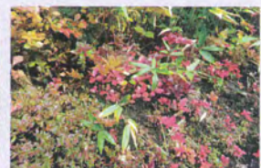
色彩かな高山植物