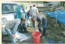
勉強になりました

土嚢制作 10月18日(日) 土嚢に入れる土の量、結び方崩れにくい積み方を学びました。