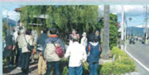
追分 奥羽・羽羽街道分岐点