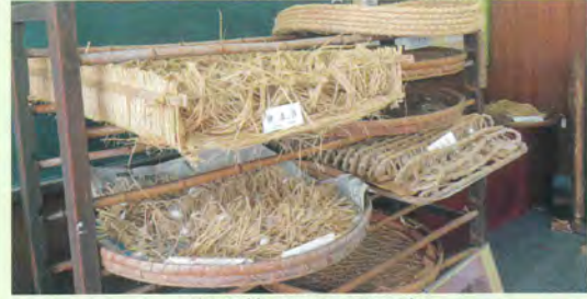
泉原養蚕用具展示室