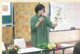
生け方はこうです