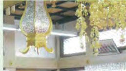
説明を聞く参加者