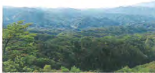
国司沢からの眺望