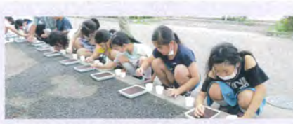
保原児童クラブ4年生