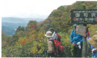
霊山縦走スタート