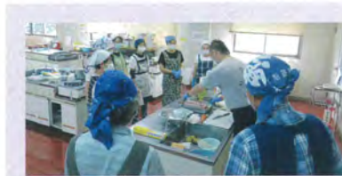
和気あいあいと調理