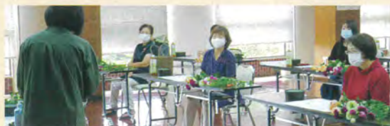
説明をよく聞いて