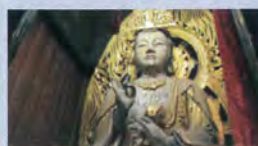
観音寺 観世音菩薩坐像