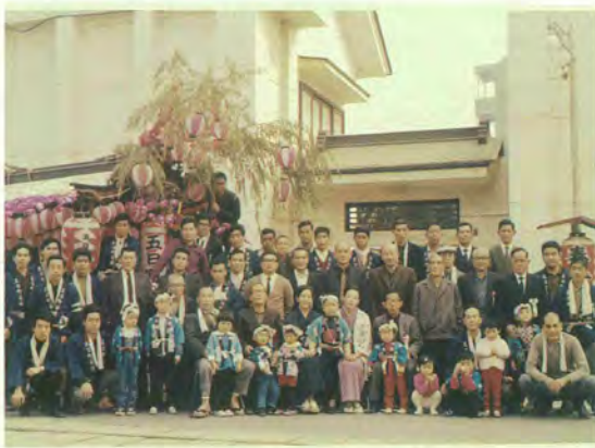
神明遷宮祭記念 五日町 昭44.10