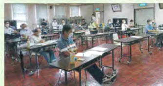
熱心に聞き入る参加者