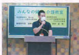
介護にかかる費用