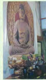
阿彌陀仏如来像写真