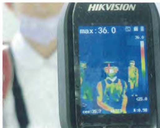
サーモグラフィー

これからも子どもたちの健やかな成長を感じられるよう、変化に対応し今できる活動を進めて参りたいと思います。