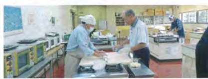
おいしい蕎麦作るぞ