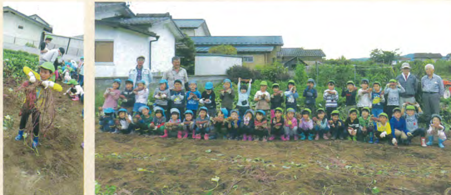
重くて大きいなあ